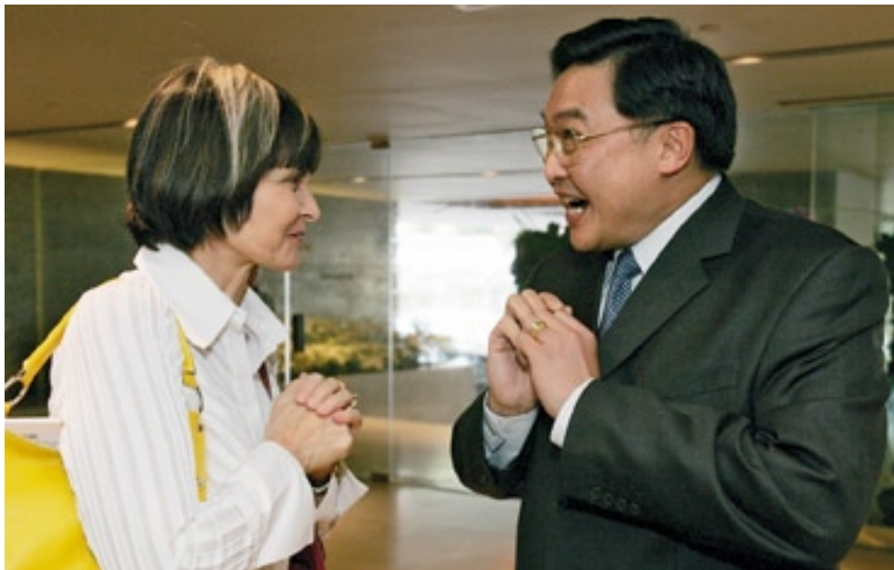
«Spontane Hilfe»: Calmy-Rey mit dem thailändischen Vize-Aussenminister Kasemsuvan.

Was er von solcher Hilfe halte, fragen wir den Lehrer. Er zögert, sagt dann mit einem Lächeln: «It's crazy» («Es ist verrückt»).