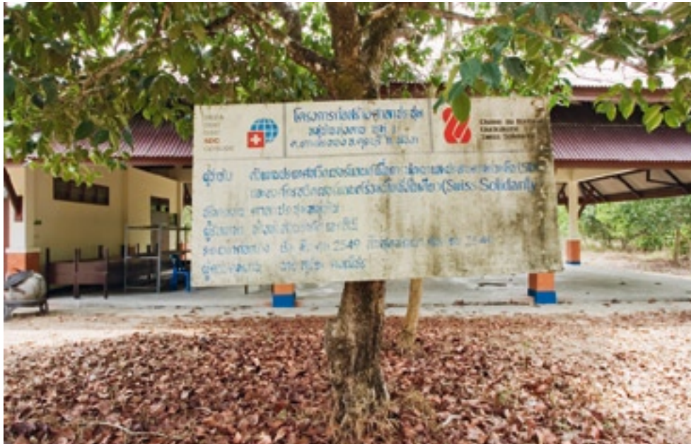
Einmal pro Monat in Betrieb: Gemeinschaftszentrum in der Ortschaft Thung Dhab.