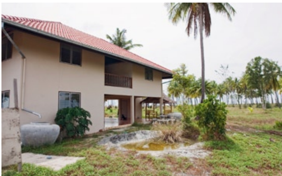
Villa in Strandnähe: Profitiert hat nicht ein Fischer, sondern ein reicher Grundbesitzer.

wir zwei Drittel der Schülerschaft vor uns. Die «Schweizer» Schule (bestehend aus zwei kompletten Schulgebäuden sowie Nebengebäuden inklusive eines Wohnhauses für Lehrer) besuchen gegenwärtig drei Kinder. In der dritten Klasse ist das Mädchen allein, der Cousin in der fünften hat einen einzigen Kameraden. Die erste, zweite, vierte und sechste Klasse hat keine Schüler, ebenso wenig wie die Oberstufe. Das vollständig wiederaufgerichtete alte Schulgebäude dient nun als Abstellraum für die Pulte, Stühle und Materialien, die im Neubau nicht gebraucht werden.