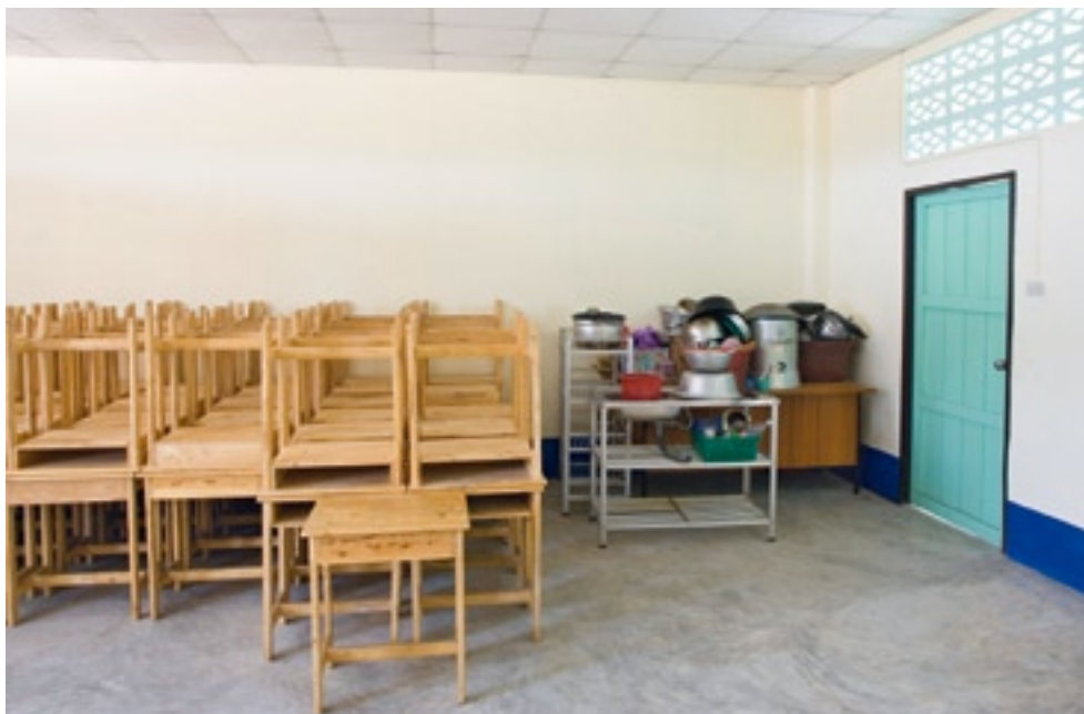
Massive Überkapazitäten: Ein Schulzimmer dient als Abstellraum.