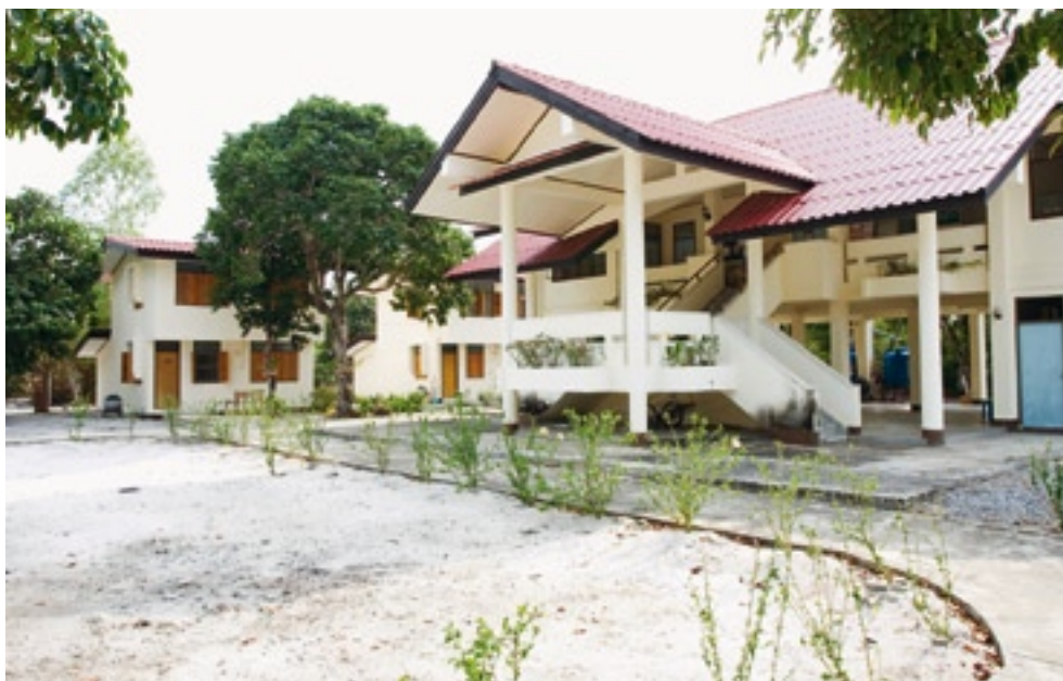
Nicht genug Kranke: Das Personal hat das Schweizer Gesundheitszentrum verlassen.

Die Zahlen sprechen für sich: Mit dem kleinen Mädchen und seinem Cousin haben