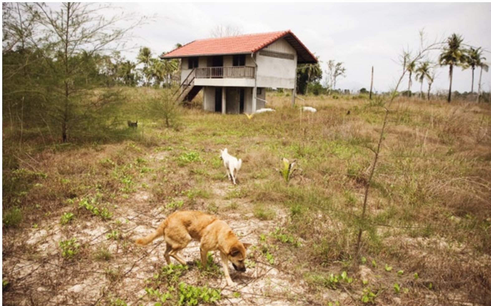
«Rehabilitation von Fischergemeinden»: leerstehendes Haus aus dem Hilfsprogramm von Deza und Glückskette in Thailand.

Wir fragen einen Mann nach dem Weg. «Warum wollt ihr zum Spital?», fragt er zurück. «Dort ist niemand.» Er versteht nicht recht, dass wir trotzdem hinwollen. Am Eingang des Geländes steht eine grosse schwarze Tafel mit der (englischen) Aufschrift: «Gespendet von Deza und Glückskette im Rahmen der Wiederherstellung von Fischergemeinden». In der Mitte des Grundstücks steht das zwei-